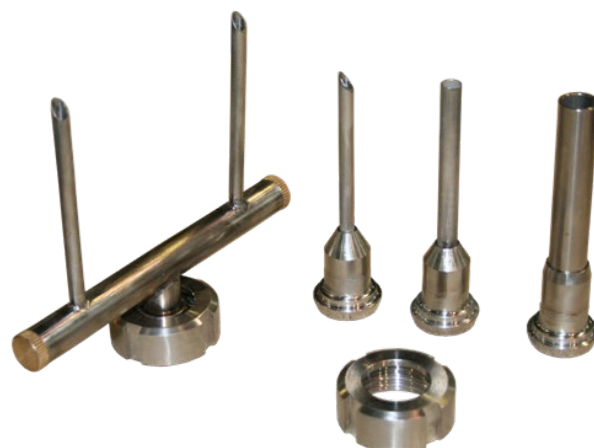
Комплект насадок базовой комплектации