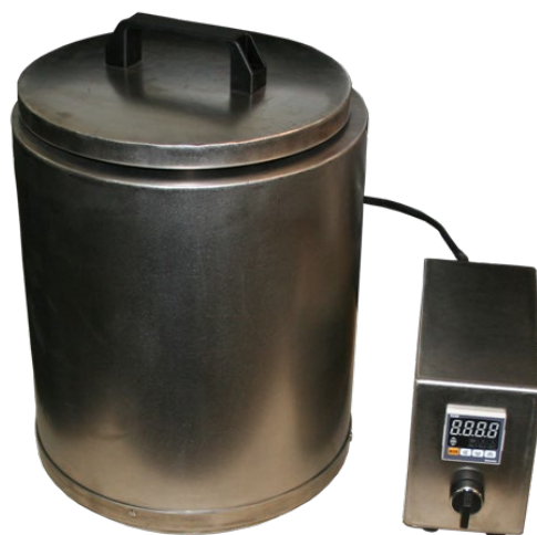
Бак с подогревом на 15 литров