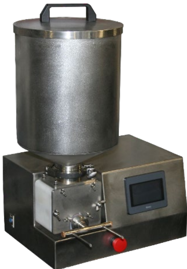
Шестеренчатый шприц-дозатор ДШ-37