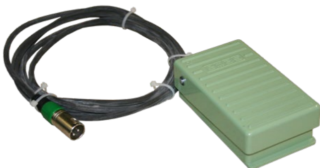
Педадь управления для ДШ-37