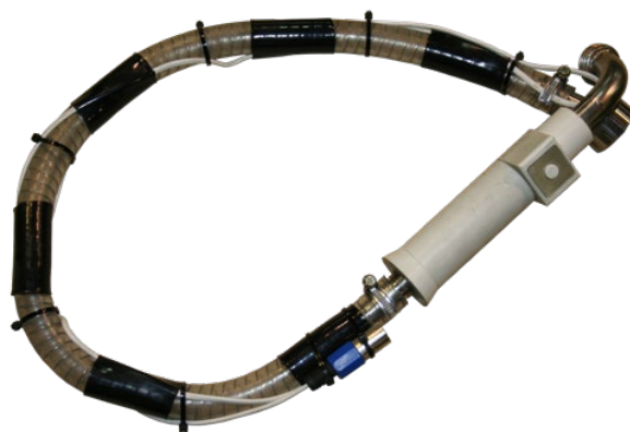
Дозирующий пистолет с армированным шлангом