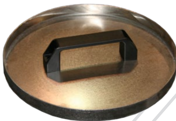
Диск для воздушной начинки