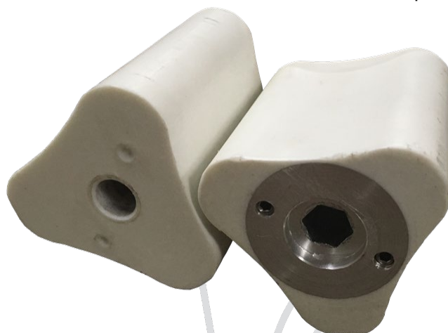
Комплект роторов (кулачков)