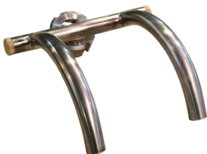
Насадка для орешков D15